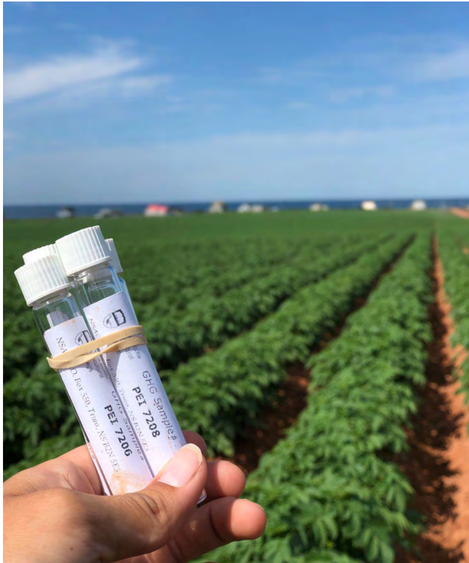
Recherche sur les GES sur une ferme de pommes de terre à l'IPE.

Le Groupe de travail sur le CSA a recensé 19 PGB réparties en cinq catégories. Toutes sont applicables et ont démontré leur capacité à atténuer les émissions de GES selon un bon rapport coût/efficacité. La section suivante se veut un résumé des constats détaillés qui sont présentés dans les rapports portant sur les émissions de GES, les aspects économiques, de même que les politiques et les programmes.