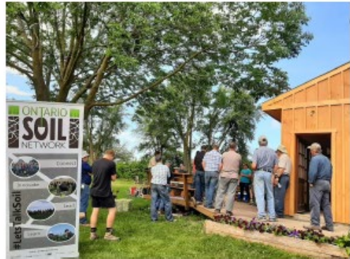
Activités du réseau