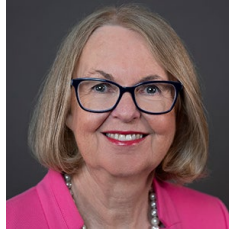
Jane Cordy Vice-présidente