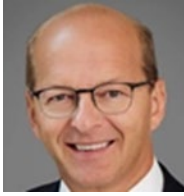
L'honorable Claude Carignan c.p. Président